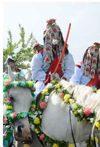
Jízda králů v Kunovicích Zelechovice nad Dřevnicí