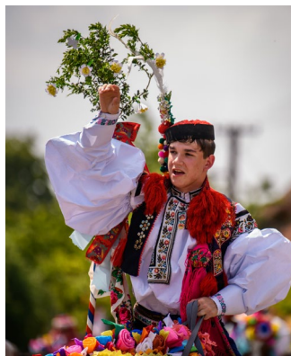
Jízda králů ve Vlnčově

Rok 2020 bude pořádná jízda! Nabídka akcí je celoročně velmi pestrá. Košty, jarmarky, koncerty, folklorní festivaly, gastrofestivaly a další slavnosti. Letošní rok na Slovácku je ale ještě něčím výjimečný – čekají nás totiž hned tři jízdy králů!