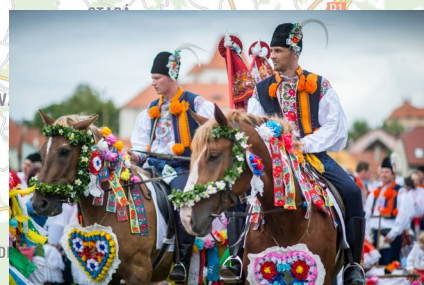
Jízda králů v Hluku