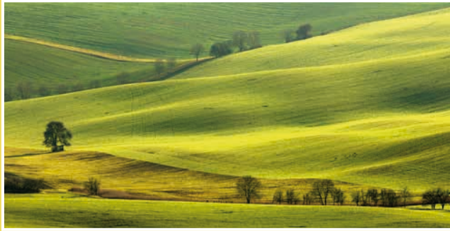
Obrázek č. 9: Výhled do krajiny z Babího lomu - vzdálenější solitérní hrušeň obklopená vlnami a liniemi. Příklad fotografie, na níž nízké světlo krajinu vymodeluje a vytvoří dojem plastičnosti.