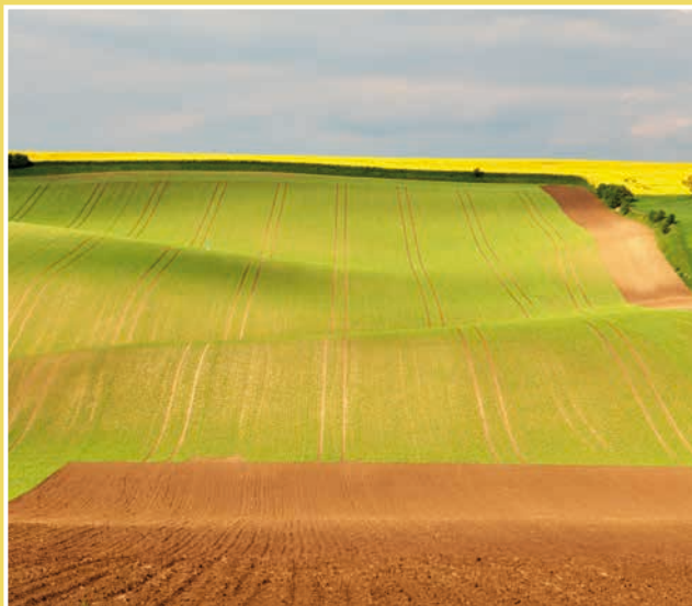
Obrázek č. 4: Jámy (jamy) - zvlněná pole nedaleko Šardic, kde se znatelně podepsala důlní činnost