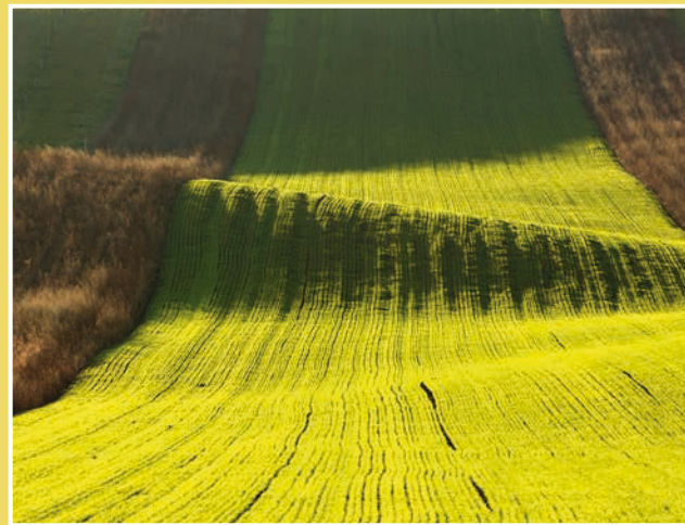
Obrázek č. 6: Bio pás