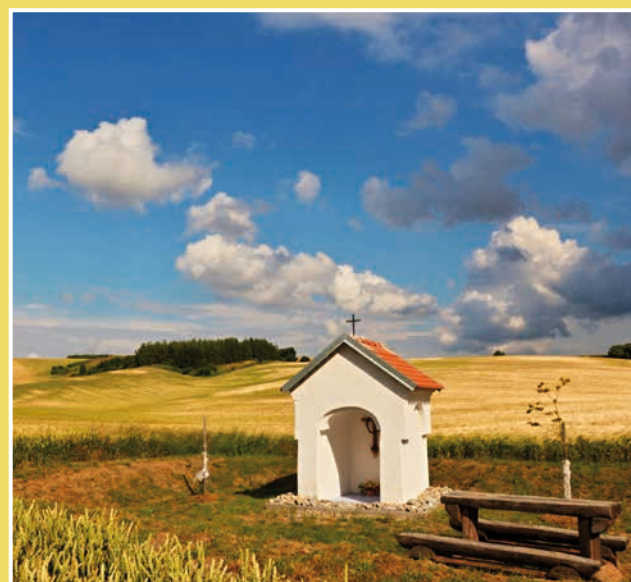
Obrázek č. 8: Kaplička Neposkvrněného početí Panny Marie