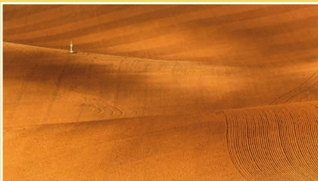
Obrázek č. 2: Jámy (jamy) – zvlněná pole nedaleko Šardic - zelený terčík v poli označuje stolu a její parametry

Výchozím bodem výletu je Informační centrum města Kyjova, odkud se vydáte vpravo na světelnou křižovatku k silnici I/54. Na ní zamíříte doleva a hned na další světelné křižovatce u autobusového nádraží zabočíte vpravo. Projedete rovně ulicí Jiráskova, přejedete železniční přejezd, odbočíte doprava a podle ukazatele směru pojedete k cyklostezce Mutěnka. Po ní pojedete až na druhé křížení s asfaltovou cestou ve Svatobořicích (cca po 4 km). Zde sjedete, zahnete vpravo (za bývalým vlakovým nádražím) a přijedete na hlavní silnici II/422 u kulturního domu. Zahnete vlevo, projedete Mistřínem a pokračujete dál po silnici č. 422 směrem na Šardice. Po cca 2,5 km dorazíte k autovrakovišti „Rajčatárna“. Zde odbočíte z hlavní silnice č. 422 vpravo a vyjedete mírný kopec po úzké asfaltové cestě. Ta je určena primárně jako obslužná komunikace pro zemědělské účely, zákaz vjezdu automobilů na ní ale neplatí, proto je nutné věnovat jíždě zvýšenou pozornost. Přijedete k místu uskladnění bioodpadu. Zde je první foto zastávka.