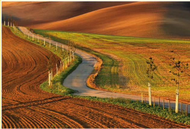
Obrázek č. 1: Asfaltová cesta pro zemědělské účely klikatící se mezi vlnami (propadající se štoly po důlní činnosti).

Trasa není náročná. Čeká vás jediný výraznější kopec, nazývaný Babí lom, známý spíše pod názvem „Stražovják“ - podle vesnice, která se na něm nachází. Pokud na něj pojedete ze směru od Stavěšic, není stoupání tak fyzicky náročné jako od Kyjova. Až na tento úsek se většinou jede po rovině, proto je trasa vhodná i pro méně zdatné jezdce. Celkem vás čeká asi 23 km a necelých 300 výškových metrů celkového stoupání.