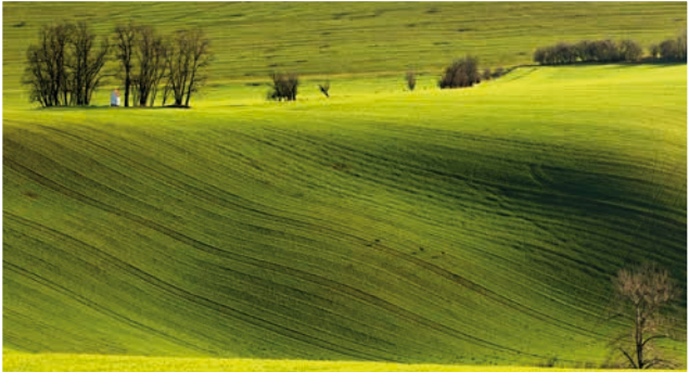
Obrázek č. 11: Výhled do krajiny z Babího lomu – kaplička sv. Barbory