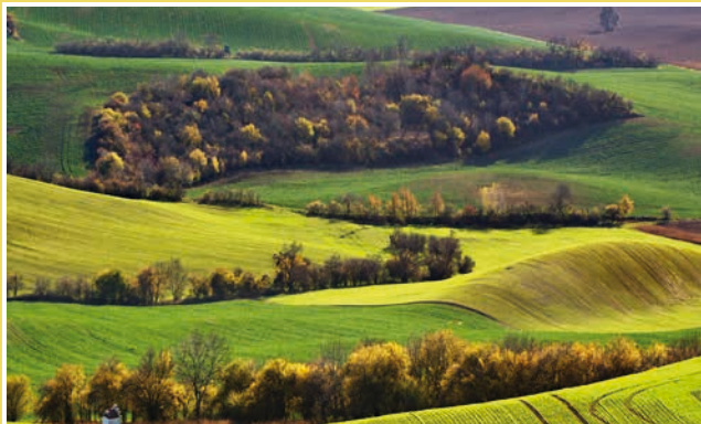
Obrázek č. 10: Výhled do krajiny z Babího lomu – krajina poskládaná „cikcak“. Příklad fotografie s trochu „širším“ záběrem na teleobjektiv