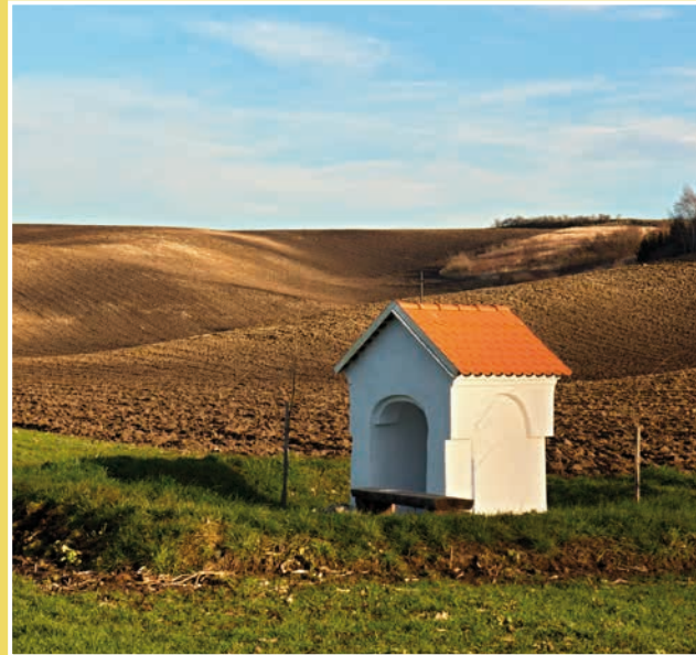
Obrázek č. 7: Kaplička Neposkvrněného početí Panny Marie

Další bio pásy najdete i na jiných místech v krajině, např. mezi Šardicemi a Hovorany a také pod Strážovicemi.