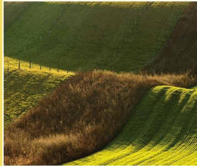
Obrázek č. 5: Bio pás

Popojedte několik set metrů dále a přijedete na další místo vhodné pro focení. Komunikace je zde rozšířená tak, aby se v méně přehledném terénu mohla vyhnout osobní auta. Na mnoha místech v poli uvidíte zelené terčíky označující stolu a její parametry.