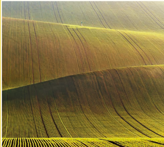
Obrázek č. 3: Jámy (jamy) – zvlněná pole nedaleko Šardic – strmost vln je umocněna propadem štol